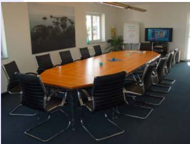
Schulungsraum in Friedberg